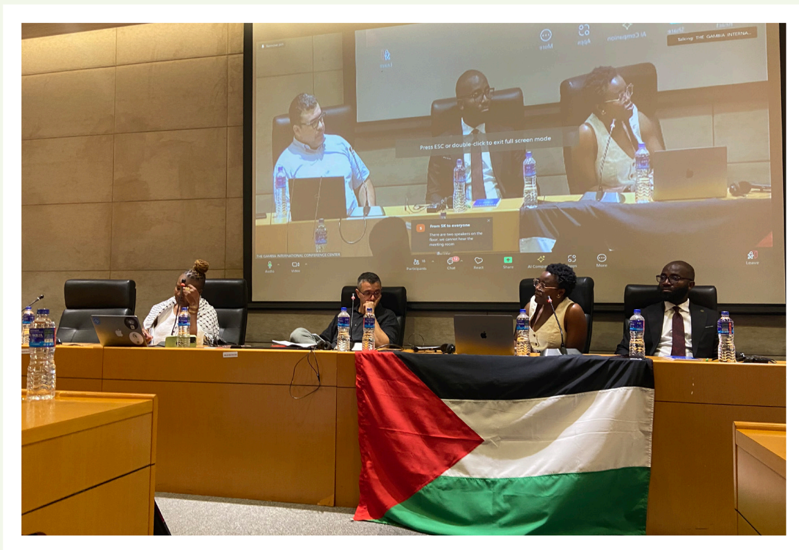
Panel sur les raisons pour lesquelles la Palestine est un problème pour le système africain des droits de l'homme