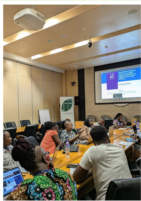
Table ronde sur la violence obstétricale