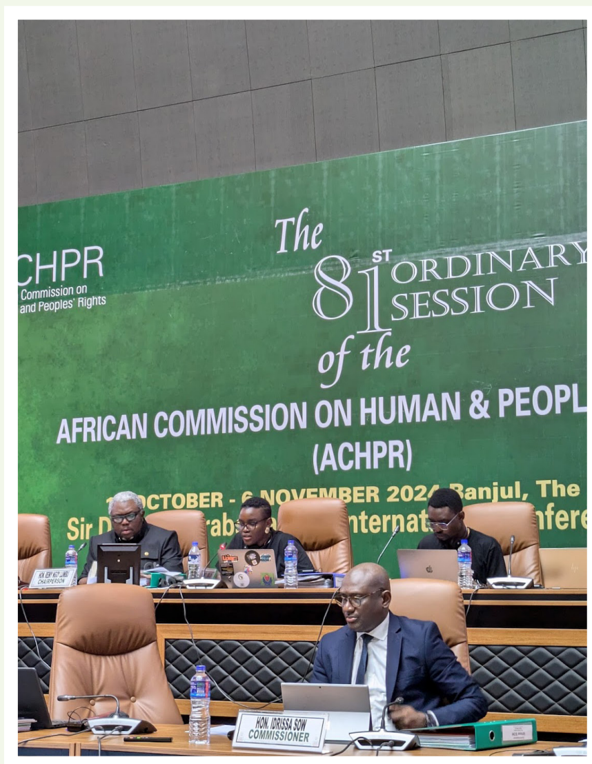
Table ronde sur l'article 59(1) de la Charte africaine