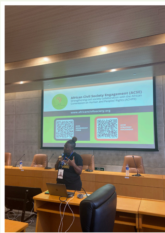
Séance d'information sur l'adhésion à l'ACSE